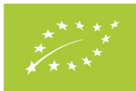
Figura 6. Sello UE